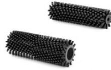
Coppia spazzole nere F25 / FB25