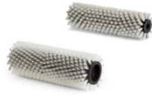
Coppia spazzole grigie F25 / FB25