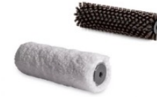
Spazzola bianca anteriore + marrone posteriore F25 / FB25