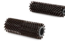
Coppia spazzole marroni F25 / FB25